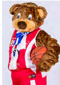
Twisti unser Maskottchen